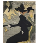
アンリ・ド・トゥールーズ＝ロートレック 《ディヴァン・ジャポネ》1893年 三菱一号館美術館

定員20名(先着順。メールにて事前申込。10.6(金)よりeventmitsubishi@mec.co.jpにて申込受付開始)