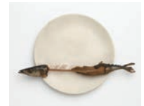
【木彫】前原冬樹《一刻:血に秋刀魚》2014年 個人蔵

17:30受付開始(日本橋三井タワー1階アトリウム)/参加費無料(要別途入館料) 定員30名(先着順。当日10:00開館以降7階受付にて参加券配布)