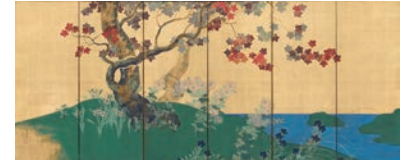
四季花木図屏風(左隻) 鈴木其一 江戸時代 出光美術館